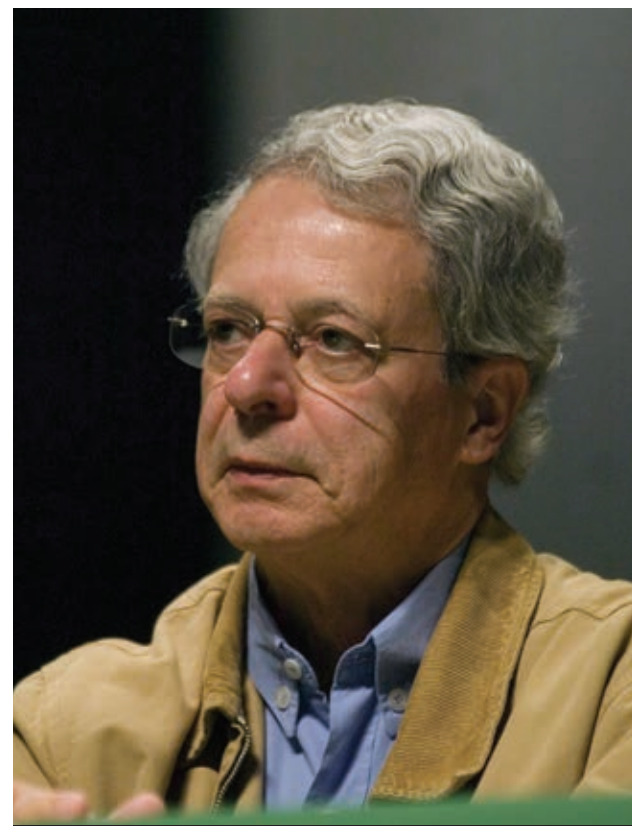
Frei Betto propõe uma reflexão a seus leitores